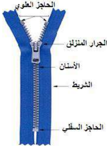
شكل (١) أجزاء الحابكة المنزلقة

وتقسم الحابكات المنزلقة وفقاً لنوع الخامة التي تصنع منها الأسنان إلى ثلاثة أنواع هي: